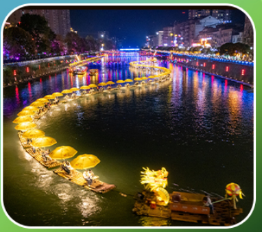
"ล่องเรือมังกรกังส่วย"