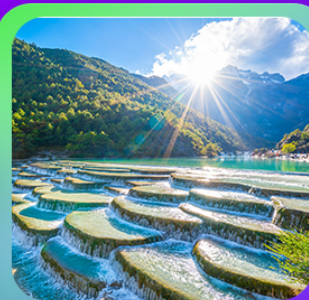
“ทะเลสาบโป้สุ่ยเหอ”