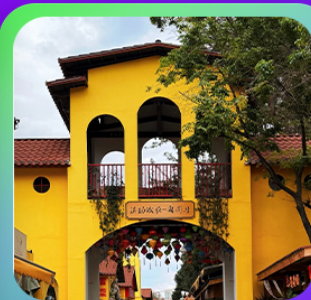
“หมาหยวนมิเตอร์กง”