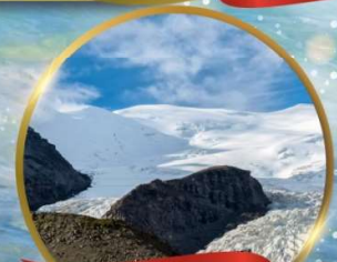
ธารน้ำแข็งคาโนล่า