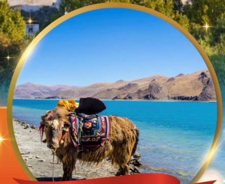
ทะเลสาบยัมดรก

"ริเบต" เมืองมหัศจรรย์หลังคาโลก พระราชวังฤดูหนาวโปตาลา วิวสุดอลังการคาโนลาคาเซียร์ อันซีนทะเลสาบศักดิ์สิทธิ์ "ทะเลสาบยัมดรก" พระราชวังโนร์บูลิงกา • วัดต้าเจา วัดที่ศักดิ์สิทธิ์ที่สุดในริเบต • ตลาดบาคอร์