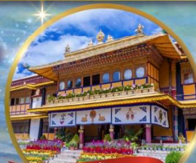
พระราชวัง โนร์บูลิงกา