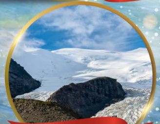
ธารน้ำแข็งคาโนลาค