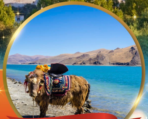
ทะเลสาบยัมดรก

"ริเบต" เมืองมหัศจรรย์หลังคาโลก พระราชวังฤดูหนาวโปตาลา วิวสุดอลังการคาโนลาคลาเซียร์ อันซีนทะเลสาบศักดิ์สิทธิ์ "ทะเลสาบยัมดรก" พระราชวังโนร์บูลิงกา • วัดต้าเจา วัดที่ศักดิ์สิทธิ์ที่สุดในริเบต • ตลาดบาคอร์