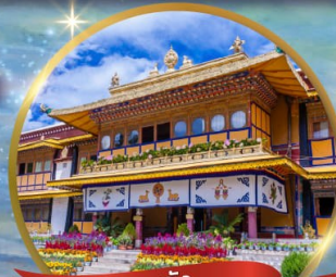
พระราชวัง โนร์บูลิงกา