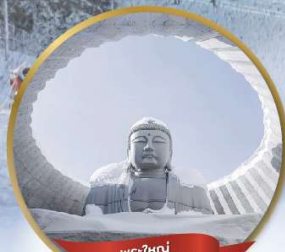
พระใหญ่ HILL OF BUDDHA