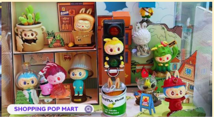
SHOPPING POP MART