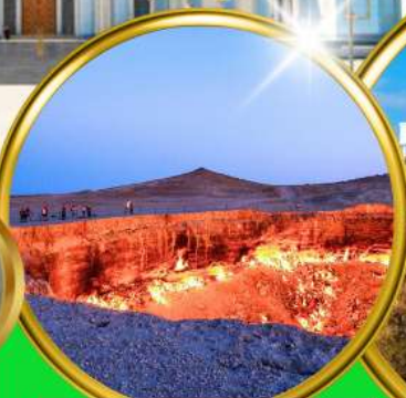
Darvaza Gate To Hell