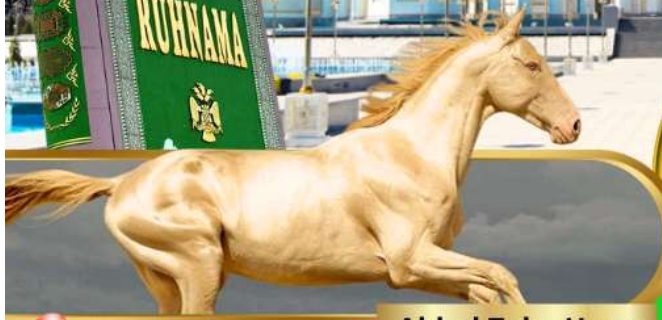
Akhal Teke Horse