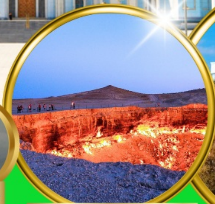
Darvaza Gate To Hell