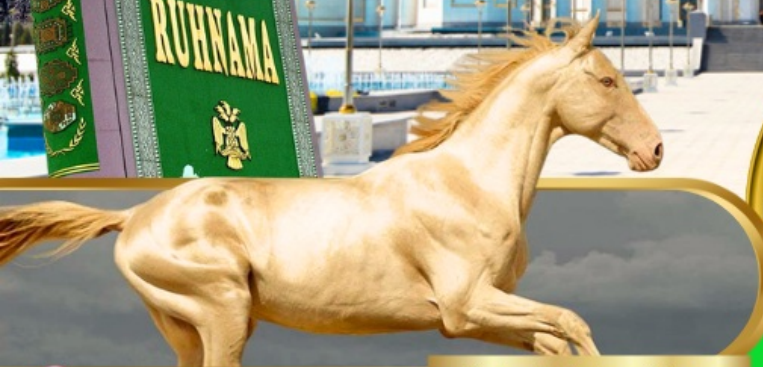
Akhal Teke Horse