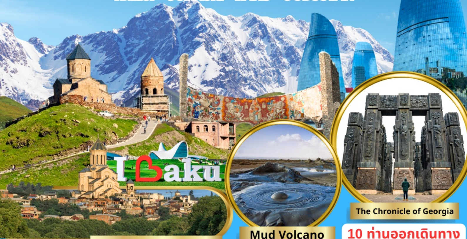
Holy Trinity Cathedral of Tbilisi