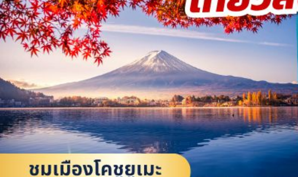
ชมเมืองโคชูยูเมะ