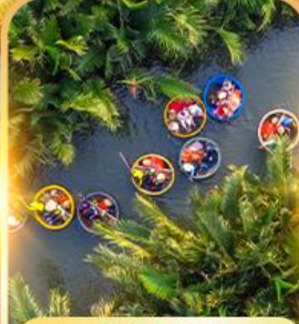
เรื่อกระดิง