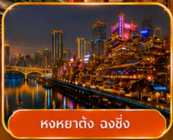
หงหยาดัง ฉงชิ่ง