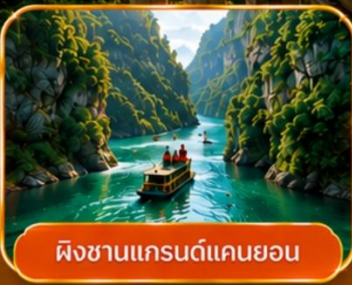
ผิงชานแกรนด์แคนยอน