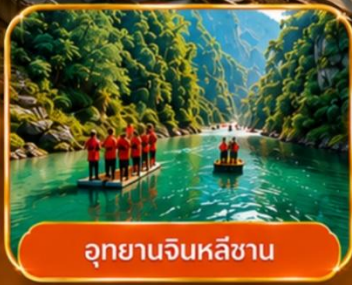
อุทยานจินหลีซาน