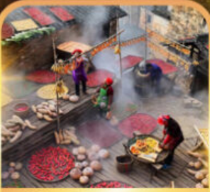
หมู่บ้านโบราณหวงหลิง