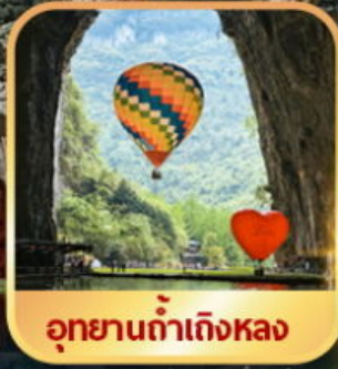
อุทยานถ้ำเหิงหลง