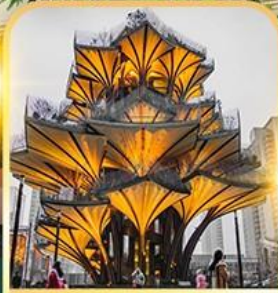
ต้นไม้แห่งชีวิต