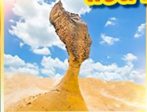
อุทยานเหย่หลิว

เที่ยวเต็ม!! 14 มิถุนายนอิสระ แช่น้ำแร่ในห้องพักส่วนตัว