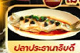
ปลาประดาน้ำ