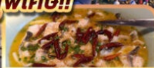
ปลาต้มพริกทอดดอง