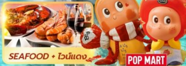
SEAFOOD + ไวน์แดง