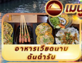
อาหารเวียดนาม ต้นตำรับ