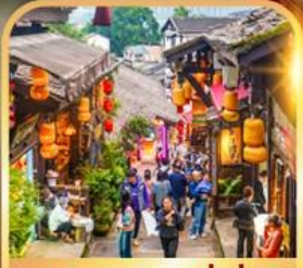
หมู่บ้านโบราณฉือซื่อ