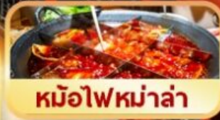
หม้อไฟหม่าล่า