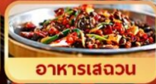
อาหารเสววน