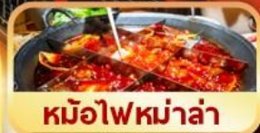
หม้อไฟหม่าล่า