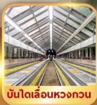
บันไดเลื่อนหวงกวน