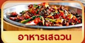
อาหารเสฉวน