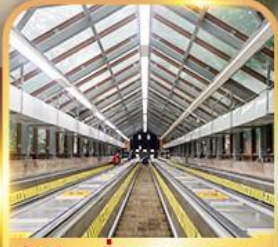
บันไดเลื่อนหวงกวน