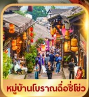
หมู่บ้านโบราณฉือชี่โซ่ว