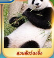
สวนสัตว์วงจิ่ง