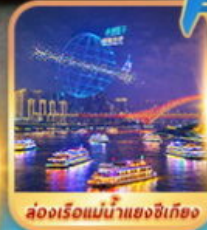
ล่องเรือแม่น้ำแยงซีเกียง