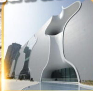
โรงละครไถจง