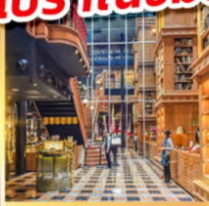
ร้านไอศกรีมมียาฮาร์