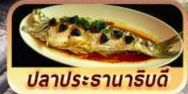
ปลาประจานาริบดี