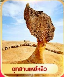
อุทยานเหย์หลิว