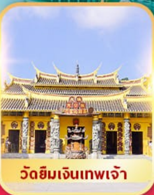
วัดยิมเงินเทพเจ้า