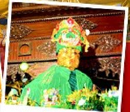
ขอพรแม่ยักษิ