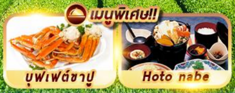
เมนูพิเศษ!!