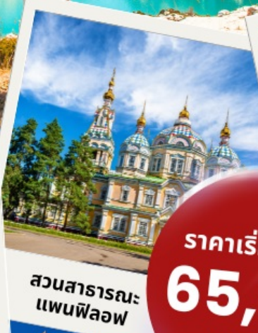
สวนสาธารณะแพนฟีลอฟ