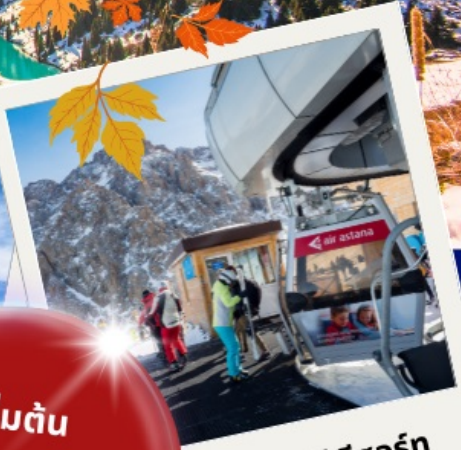
ซิมบูลัก สกี รีสอร์ท