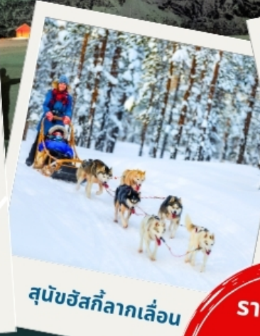
สุนัขฮัสกีลากเลื่อน