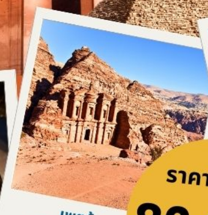
เพตรา นครศิลาสีชมพู