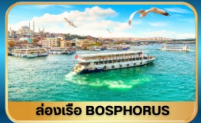
ล่องเรือ BOSPHORUS