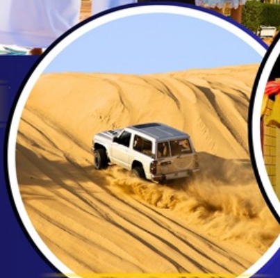
ทะเลทราย 4X4