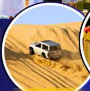
รถเช่าราย 4X4