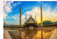
มัสยิดไฟซาล

DAY8 ตักศิลา-พิพิธภัณฑ์ตักศิลา-อิสลามาบัด- มัสยิดไฟซาล-Shopping-กรุงเทพ