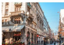
วิหารเซนต์ซาวา บ่อมปราการเมลเกรต ถนน Knez Mihailova

** พักที่ Abba Hotel 4* หรือเทียบเท่า **