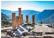
วิหารเทอพอลโล

** พักที่ Divani Meteora Hotel 4* หรือเทียบเท่า **