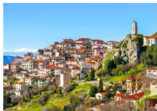
เมืองอราคอว่า

05.10 น. เดินทางถึงสนามบินอิสตันบูล แวะเปลี่ยนเครื่อง 07.30 น. ออกเดินทางสู่กรุงเอเธนส์ เที่ยวบิน TK1843 08.55 น. เดินทางถึงสนามบินกรุงเอเธนส์ ประเทศกรีซ