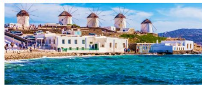
เกาะมิโคนอส

** พักที่ Camarades Hotel 4* หรือเทียบเท่า **