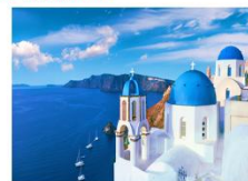
เกาะซานโตรินี่

** พักที่ Aelia Suites Karterados Hotel 4* หรือเทียบเท่า **