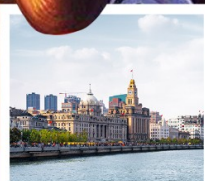
หาดไว่ทาน