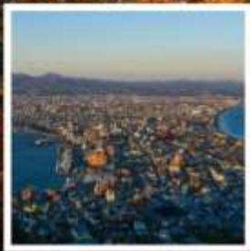
กระเช้าภูเขาฮาโกดาเตะ