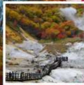
หุบเขานรก จิโคะคุดามิ