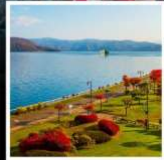
ล่องเรือชมทะเลสาบโทยะ

กระเช้าภูเขาฮาโกดาเตะ ชมวิวที่สวยงามที่สุด 1 ใน 3 ของญี่ปุ่น ระดับมิชลิน 3 ดาว ชมสวนฟูจิตาชิ 1 ในแหล่งน้ำที่สะอาดที่สุดจากยอดเขาโยเทอิ ถ่ายมุมไหนก็สวยงาม หุบเขานรก จิโคะคุดามิ ชมบรรยากาศของแหล่งกำเนิดออนเซ็นชื่อดังที่สุดแห่งฮอกไกโด อุทยานแห่งชาติโอनुมะ กับทิวทัศน์ภูเขา และทะเลสาบ สุดแปลกตา สันเขื่อนโฮเฮเคียว มนต์เสน่ห์แห่งใบไม้เปลี่ยนสีที่รอคุณมาสัมผัส ล่องเรือกลางทะเลสาบโทยะ ท่ามกลางบรรยากาศใบไม้เปลี่ยนสี มนต์เสน่ห์ที่ต้องค้นหา พักออนเซ็น 2 คับ!!! / ชิปโปโร..พักใจกลางแหล่งช้อปปิ้ง 2 คับ อาหารพิเศษ...บุฟเฟ่ต์ซาปูยักษ์, บุฟเฟ่ต์ซาบู กรุ๊ปสบายๆ เพียง 20 ท่านเท่านั้น!!!