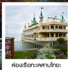
ล่องเรือทะเลสาบโทยะ