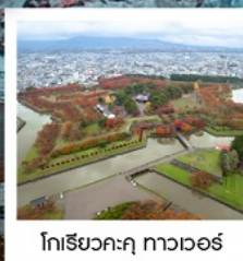
โทริยวคะคุ ทาวเวอร์

PERIOD 1 : 21 - 26 ต.ค. 67 | PERIOD 2 : 23 - 28 ต.ค. 67