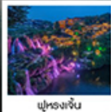
ฟูรงเจิน