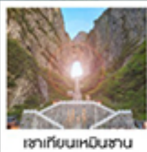
เขาก๊วยหมินซาน