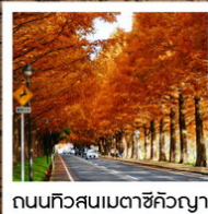
ถนนทิวสนเมตาชิคิวญา