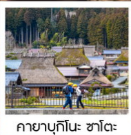
คยาบุกิโนะ: ซาโตะ