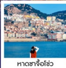
หาดซาจื่อฮั่ว