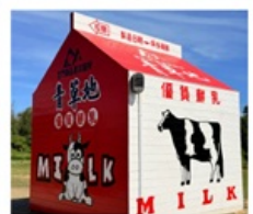
ฟาร์มโคนมจินเหมิน