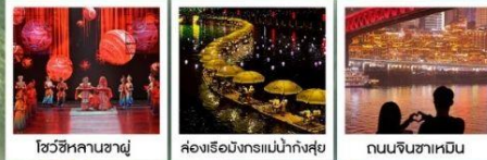
โชว์ซีหลานซาตู้