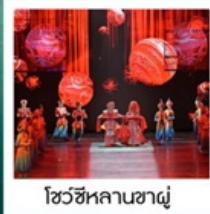
โชว์ซีหลานซาตู้