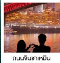
ถนนจินซาเหมิน