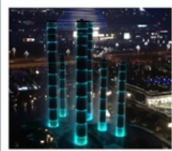
ห้างสรรพสินค้า SKP