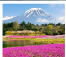
ทะเลสาบโมโตสุ ทุ่งพืชมอส