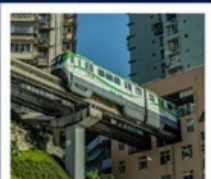
นั่งรถไฟทะลุติ๊ก