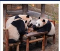
สวนสัตว์ฉงชิ่ง

สวนสัตว์ฉงชิ่ง • เมืองโบราณซือปาเก้ • หมู่บ้านโบราณฉือซีฮั่ว • มหาศาลาประชาม นั่งรถไฟทะลุติ๊ก • ถนนโบราณหลงเหมินเฮ่า • ถนนเซี่ยเฮ่าหลี่ • วัดหลิวอัน • Raffles City • หงหยาดัง ถนนคนเดินเจี่ยฟ่างเป่ย์ POP MART • ล่องเรือแม่น้ำแยงซีเกียง • พิพิธภัณฑ์ศิลปะฉงชิ่ง • ตึกชวยซิง 22 ชั้น • THE RING MALL