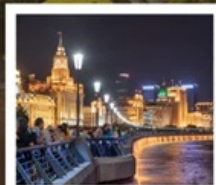
เซี่ยงไฮ้คลาสสิกไท่

เซี่ยงไฮ้ คลาสสิก ไท่ / 3 ตึกใหญ่แห่งเซี่ยงไฮ้ ล่องเรือหมู่บ้านโบราณจูเจียเจี้ยว / EKA Tianwu / ถนนหอยไผ่ วัดหลงหิวแลนด์มาร์ก จางหยวน / ซินเทียนตี้ / ชมโชว์ ERA ที่โรงละครโด่งดังระดับโลก