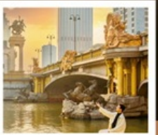
ย่านอิตาลี