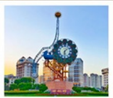
นาฬิกาตวรรษ