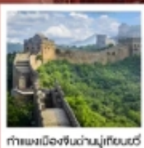
กำแพงเมืองจีนด้านมู่เถียนยวี่