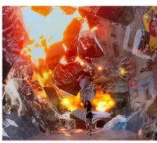
SPACE & TIME CUBE