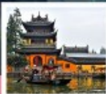
หมู่บ้านโบราณจูเจียเจียว

สวนสนุกยูนิเวอร์แซลปักกิ่ง / สวนสนุกเซี่ยงไฮ้ดิสนีย์แลนด์ / หมู่บ้านโบราณจูเจียเจียว ขึ้นหอไข่มุก / ลอดอุโมงค์เซเซอร์ / หาดวี้ทาม / จิตตสมาธิบนอิมเหมิน พระราชวังโบราณกู้กง / กำแพงเมืองจีนด่านจหยงทวน สนามกีฬาโอลิมปิกปักกิ่ง / ถนนโบราณเฉียนเหมิน