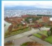
โทริยิวกะกุ ทาวเวอร์

หุบเขานรกจิโระคุดาบิ / โทดองฮังงะงะคาเนโมริ ตลาดเช้าเมืองฮาโกดาเตะ / โทริยิวกะกุ ทาวเวอร์ ภูเขาไฟอุสุ / จุดชมวิวยุซึกิ / ค่องเรือชมทะเลสาบโทบะ สวนอุสึกิโตะ / สวนพฤกษศาสตร์ / เก็บผลไม้ / สัมผัสน้ำพุร้อนที่วิว พิพิธภัณฑ์หอคอยดนตรี / นาฬิกาไอน้ำโบราณ / โรงเบียร์แก้วคิตาอิชิ เนินพระพุทธรเจ้า / ถนนฮิโอบังทากุโกจิ / ย่านซูซุกิโนะ