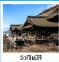
วัดโทอินจิ