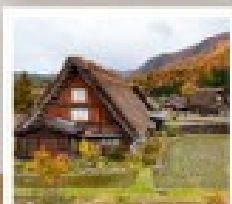
ริซุซุเดระ