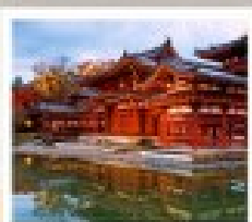
โตะเออิออนเซ็น