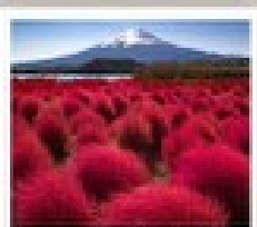
คามิโกชิ ปาร์ค

วัดเมียวโตะอิน / ถนนเมียวโตะอิน โฮโมเตะชินโต / ฟูชิมิ ฮันริ ริซากาวาโกะ / อินมาชิ ซูจิ / คามิโกจิ / สะพานกินโปะ / สวนโตะฮิชิ ปาร์ค ตุ้มงกิบอนเน็ค / โอชิโนะ ฮักไก / สวนโตะวะคิเนน / วัดอาซากุสะ ตลาดปลาซึกิจิ / ฮิโระบึงฮิมะรุคุ / มิดซุบะ เฮอท์เล็ท พาร์ค คิซารุชิ