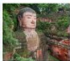
หลวงพ่อดีดเค่อซาน